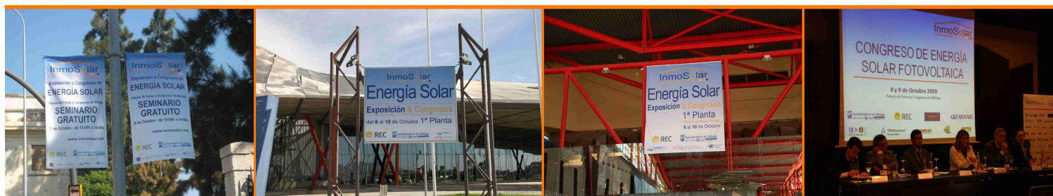
Banderolas en ciudad